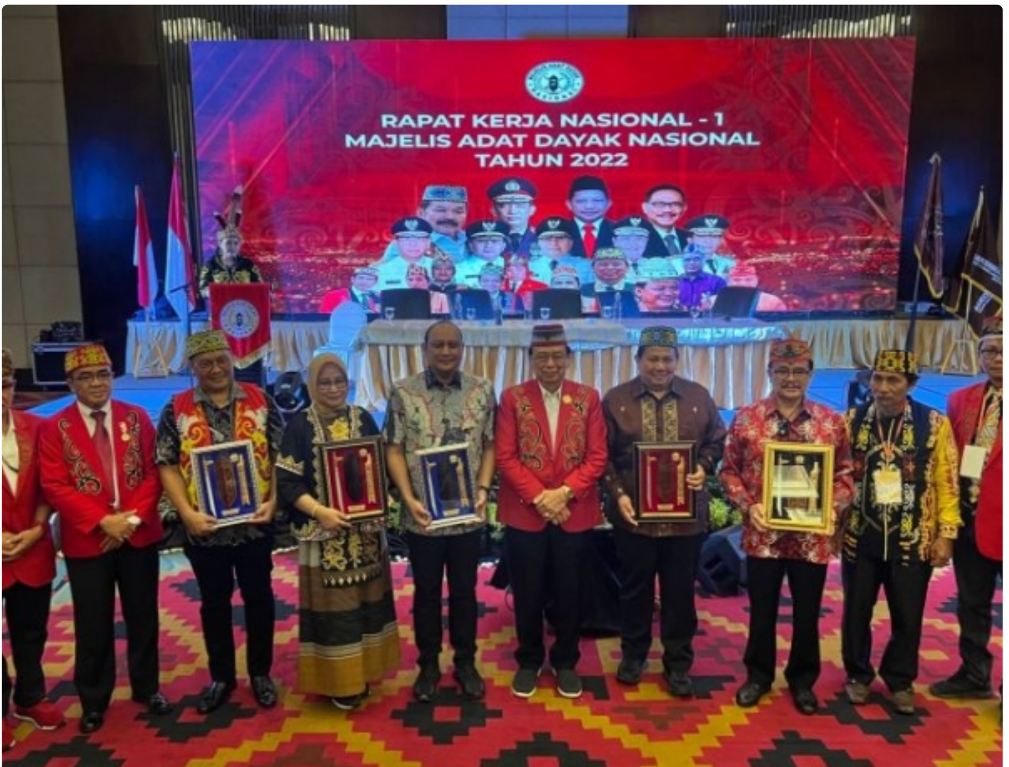
Ucapan Selamat dan Sukses Atas Diberi Anugerah Warga Kehormatan dari MADN

PALANGKA RAYA - Ketua Dewan Pimpinan Daerah (DPD) Jaringan Organisasi Masyarakat Nusantara (JOMAN) Kalimantan Tengah, mengapresiasi atas diberinya penganugerahan gelar Warga Kehormatan Utama, oleh masyarakat