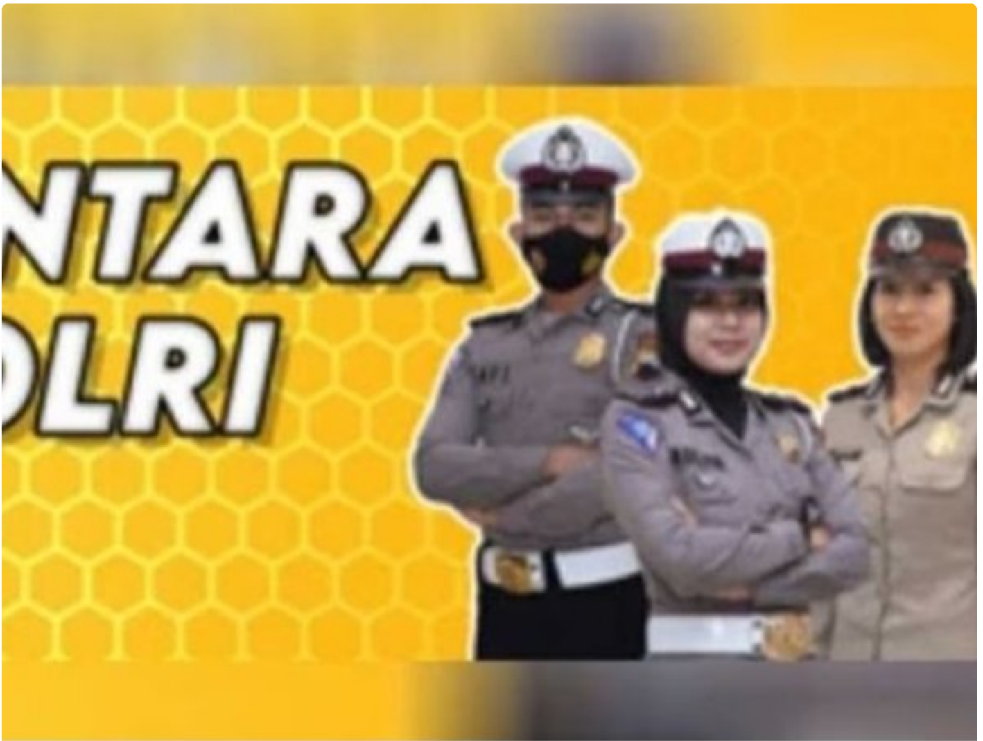
Penerimaan Polri Bakomsus

PALANGKA RAYA - Kesempatan terbuka bagi lulusan bidang pertanian, perikanan, peternakan, gizi, dan kesehatan masyarakat untuk bergabung menjadi anggota Polri melalui program penerimaan Bintara Kompetensi Khusus (Bakomsus).